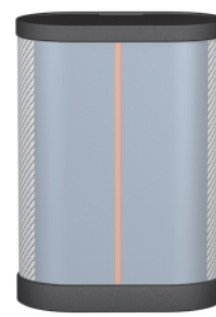
Widok z tyłu (zakładka pod grafiką)